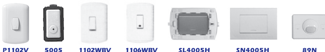
P1102V 5005 1102WBV 1106WBV SL4005H SN4005H 89N